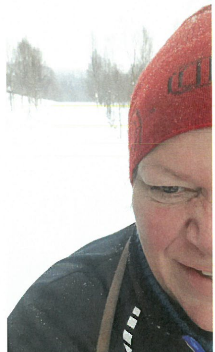
Kåret til beste bilde.