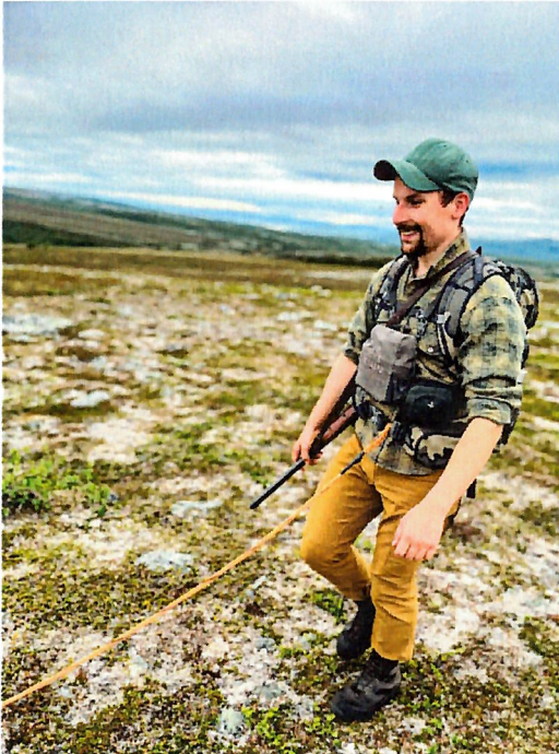
(Bilde, J. Varras, 2023).